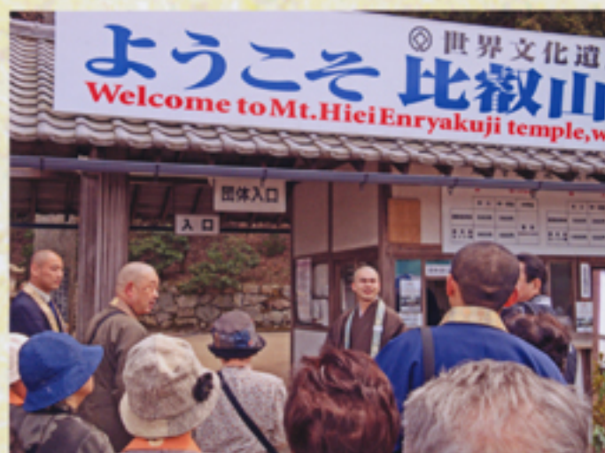
参道沿いの絵図により 担当僧の案内を受ける