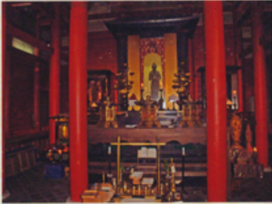
ご本尊を拝し般若心経を唱える