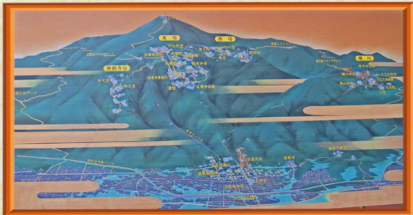
比叡山全体図（参拝道筋に揭示）