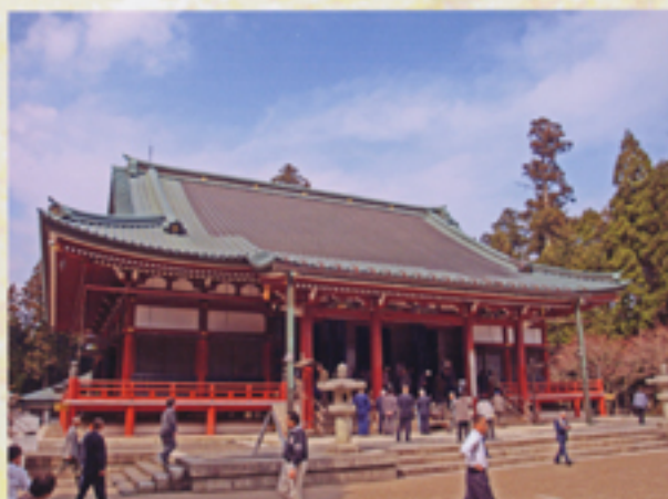
大講堂参拝し講話を受ける