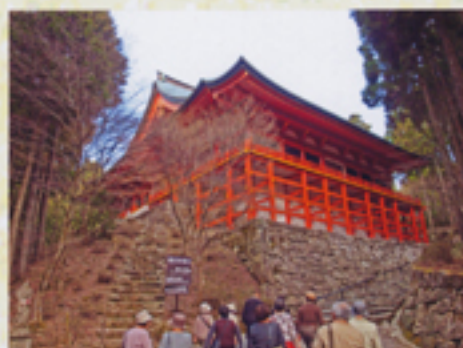
坂道を登り横川中堂へ