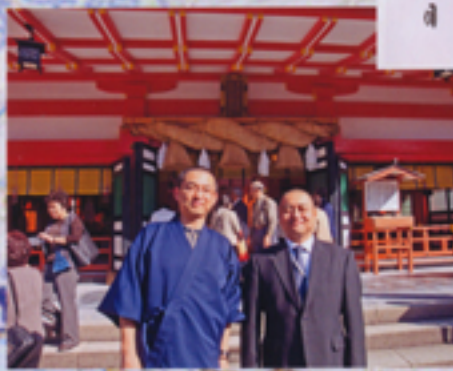
左・三光院住職 右・自性寺住職