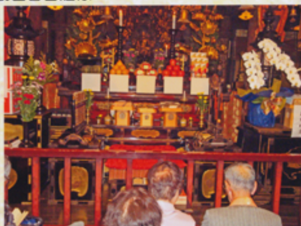
本堂内陣で般若心経を唱える