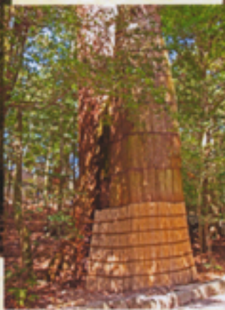
ご神木の保護囲い