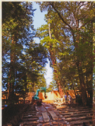
外宮建替え工事中