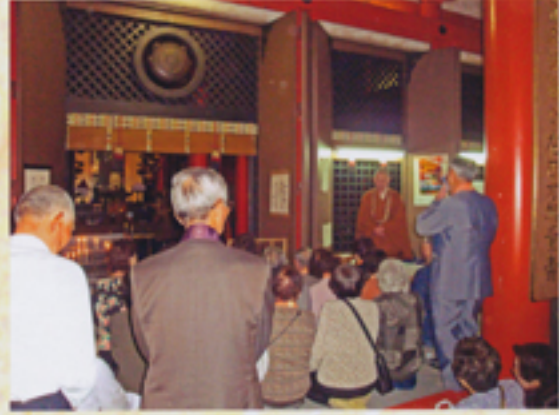
梅山僧侶から法話をいただく