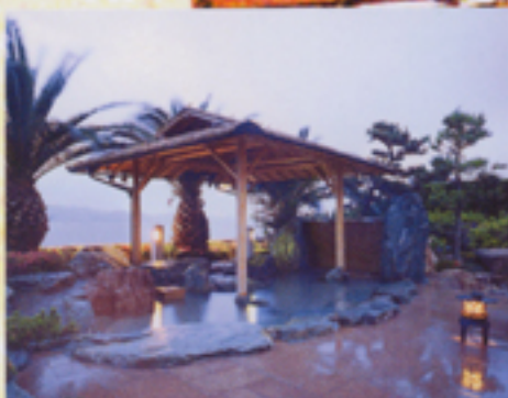
遠く那智大滝が見える 露天風呂『滝見の湯』