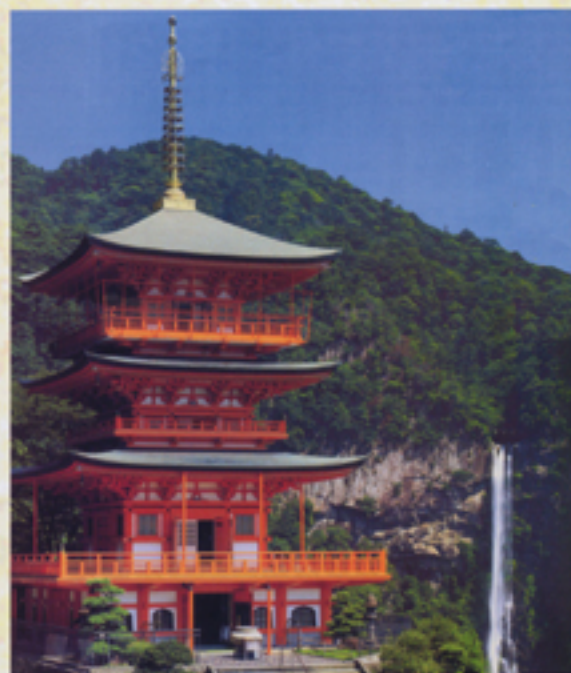
雨で参拝できなかった 三重塔と那智大滝