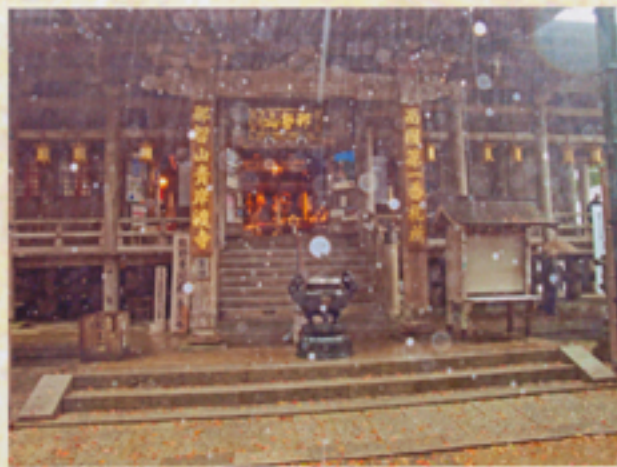
那智山青岸渡寺本堂参拝にも雨降りやまず