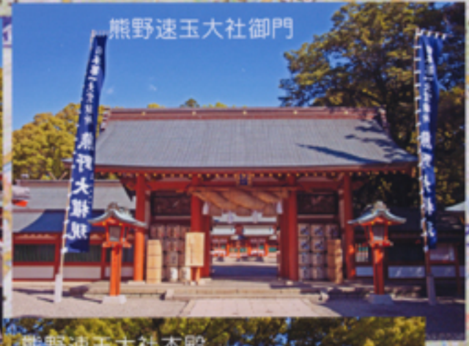
熊野速玉大社御門