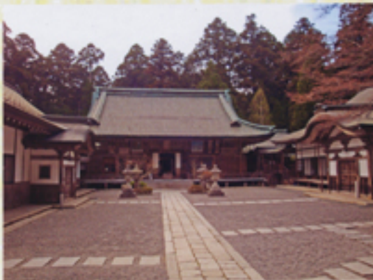
元三大師堂を参拝しご祈祷いただく