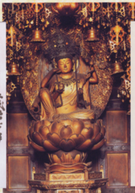
本尊の如意輪観世音菩薩像