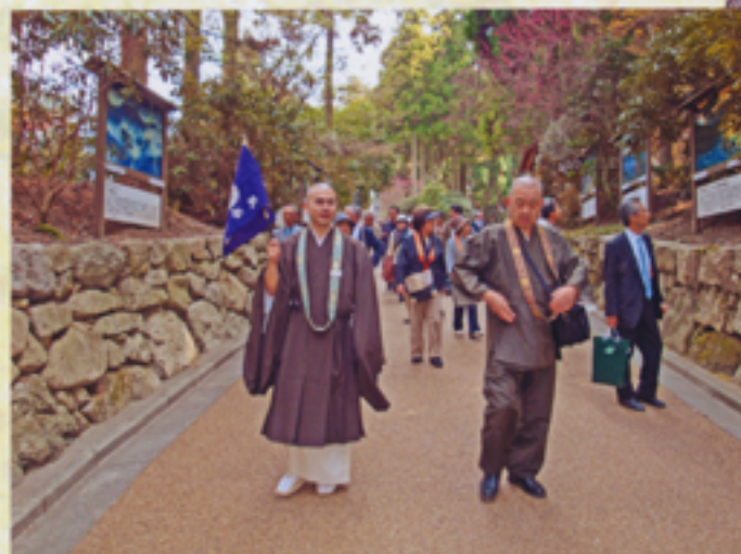
大講堂・平和の鐘・根本中堂の 参拝を終えて戻る