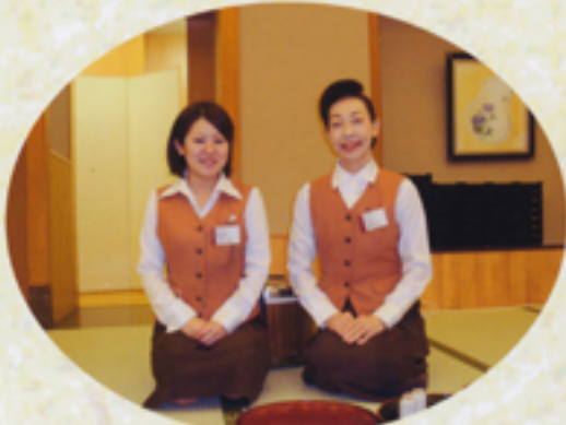
心地よいもてなでリフレッシュ