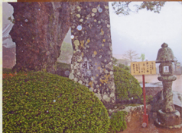
天然記念物樹齢700年タブノキ