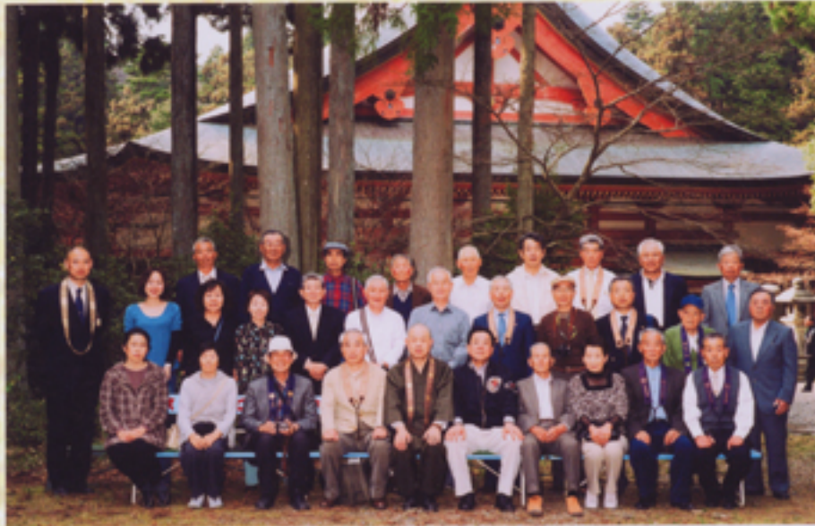
天台宗群馬教区沼田部 比叡山延暦寺参拝記念 平成21年4月13日 於 横川中堂