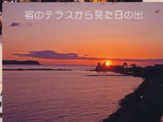
宿のテラスから見た日の出