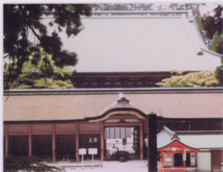
根本中堂内で参拝し法話を受ける