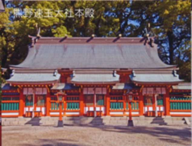
熊野速玉大社本殿