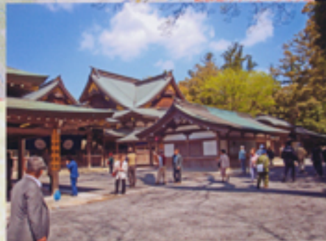
奥の建物が神楽殿