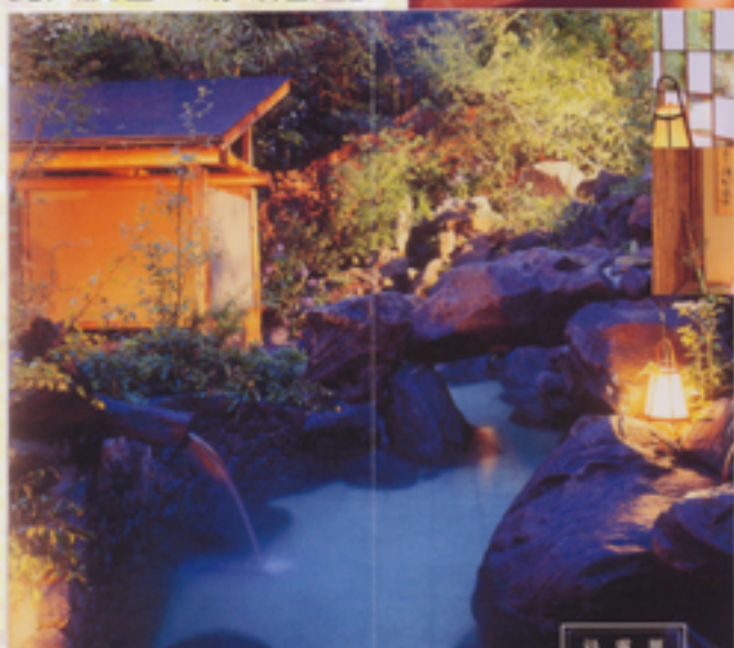
琵琶湖を見下ろして湯につかる露天風呂