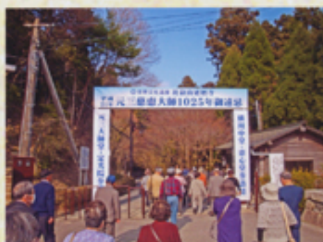
バスで移動し横川へ向かう