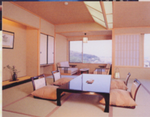
落ち着いた客室からは琵琶湖や大津の街を一望