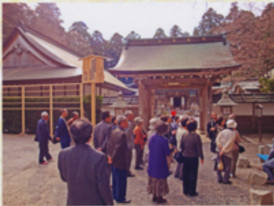
角大師の由来を拝聴