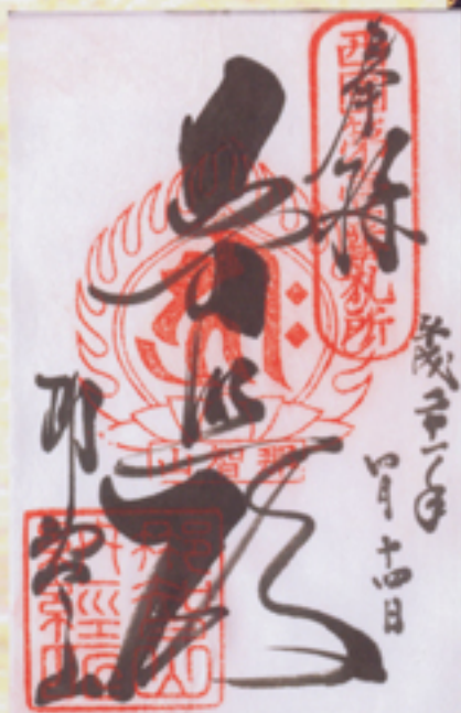
御朱印をいただく