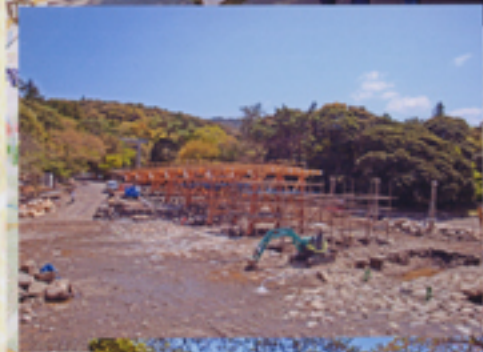
宇治橋架け替え工事