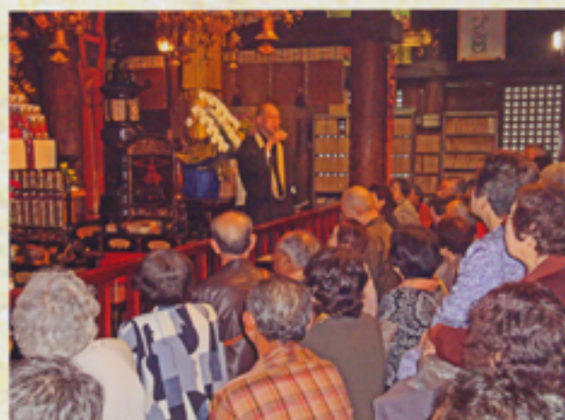
副住職のご挨拶をいただく