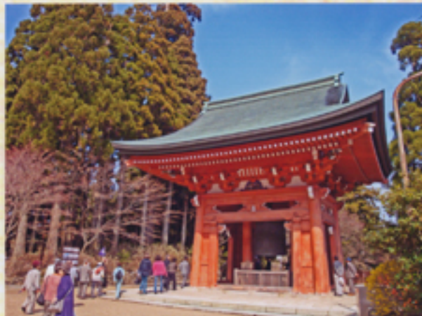
大講堂境内に建つ平和の鐘