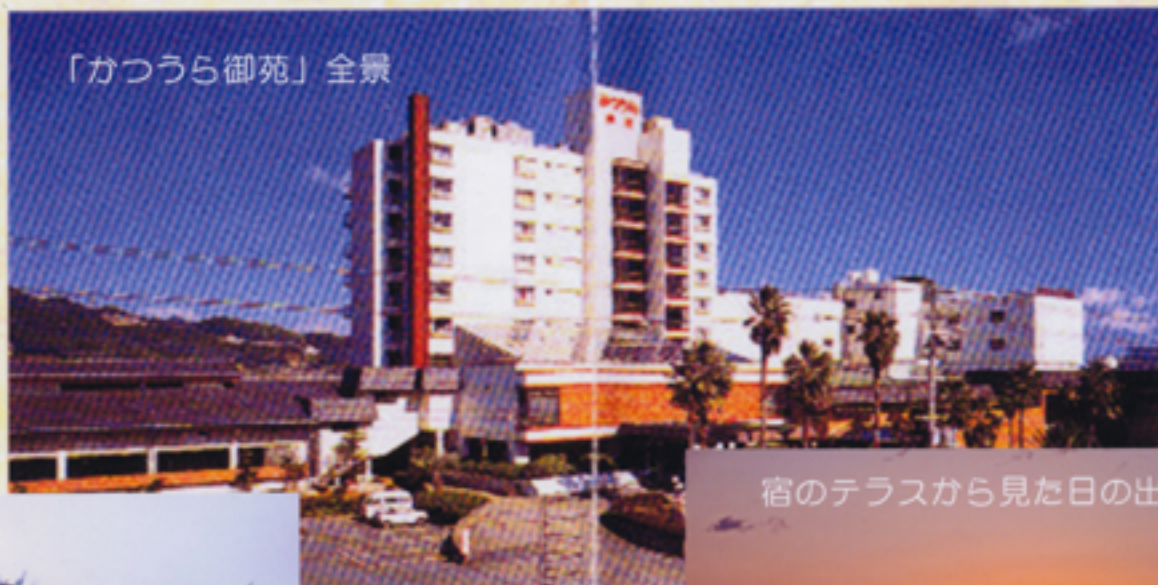
「かつうら御苑」全景