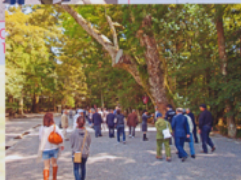
内宮に向けて砂利道を歩く