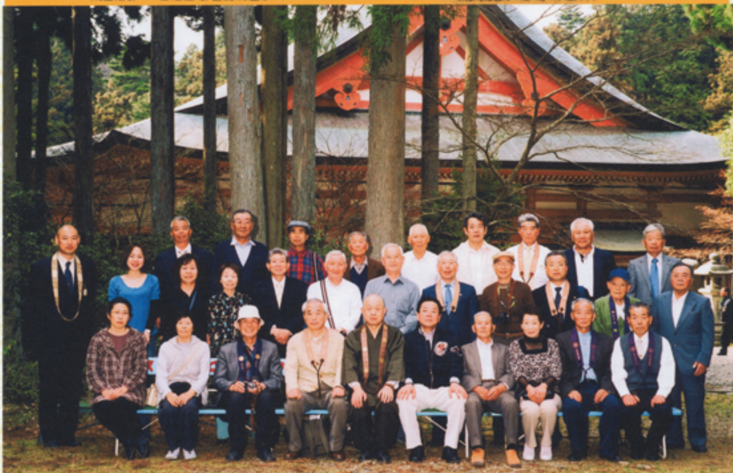
天台宗群馬教区沼田部 比叡山延暦寺参拝記念 平成21年4月13日 於 横川中堂