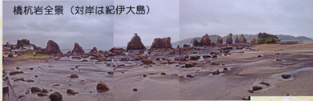
橋杭岩全景（対岸は紀伊大島）