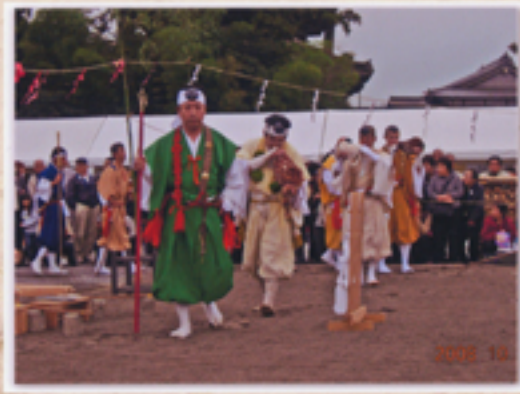
法螺貝を吹き山伏一巡