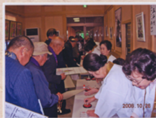
三十六の御朱印を受ける長い列