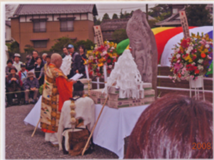
導師による開式の儀