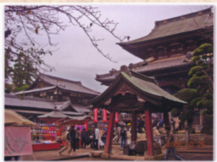
賑わいを見せる大本堂