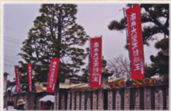
小雨の降る中、不動院に着く