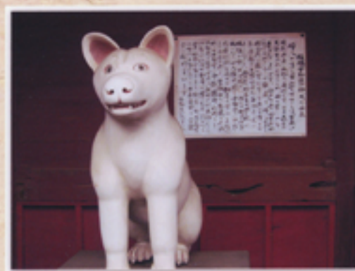
楼門阿吽像の裏手に鎮座して 安産の御利益あるお犬不動尊