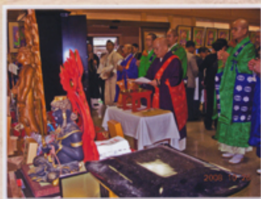
居並ぶ僧たちによる法要