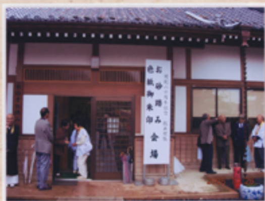
お砂踏み・御朱印会場