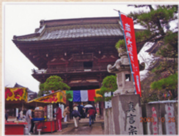
楼門参道に露天店が並ぶ