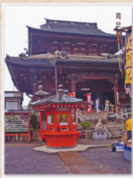
大本堂前に派手に目につく 朱色のおみくじ堂がある