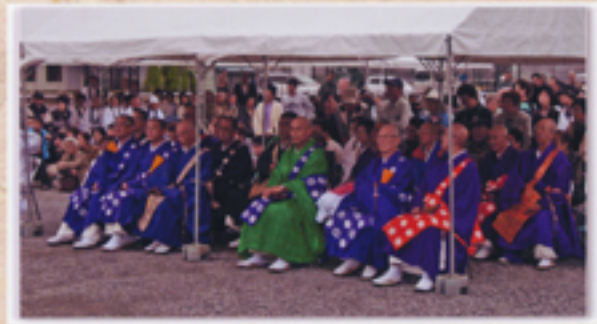
正装して参列する多数の僧