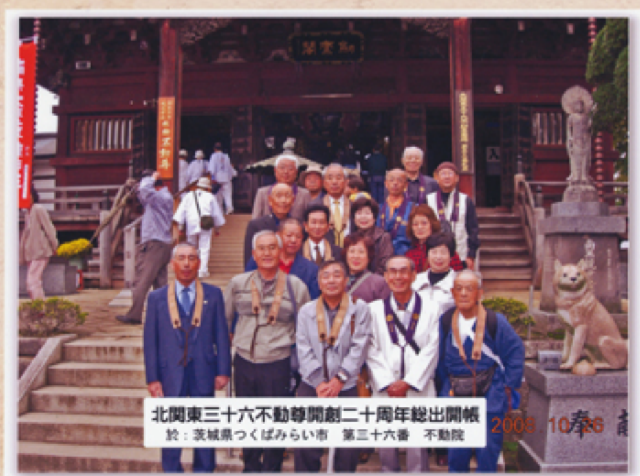
北関東三十六不動尊開創二十周年総出開帳 於：茨城県つくばみらい市 第三十六番 不動院