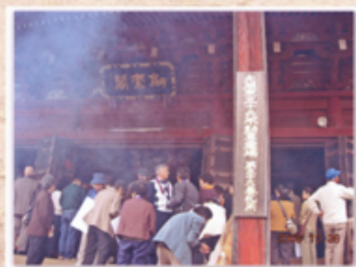
参拝者の線香に煙る大本堂入り口