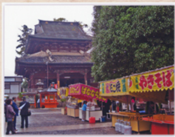
大本堂前の境内にも 露天店が並んで