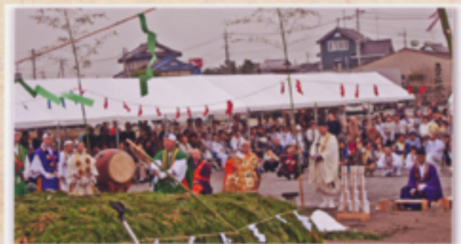
剣によるお祓いの儀