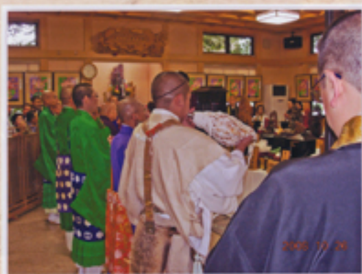
法螺貝が鳴り響く