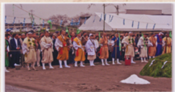
開式を見守る山伏たち