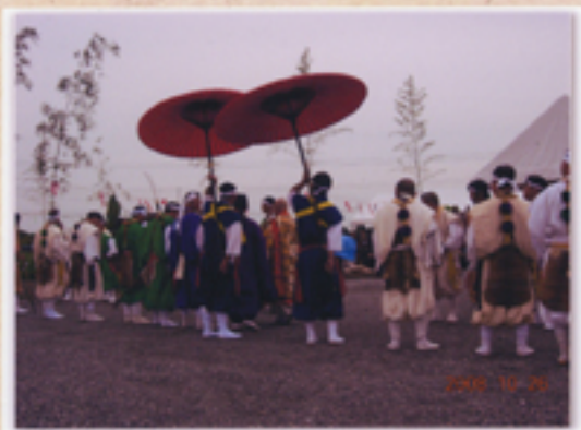
導師入場を迎える山伏