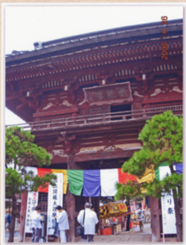
見事な構えの楼門『智恵楼』