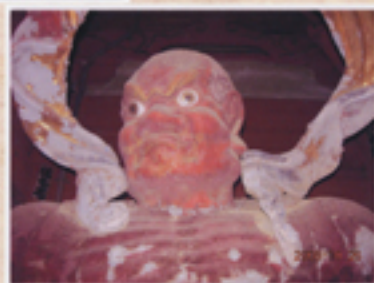
楼門の両袖にいて 邪気を祓う阿吽像