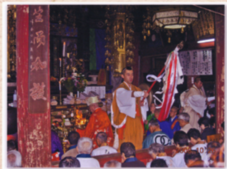
大護摩修行で参拝者にされるお祓い