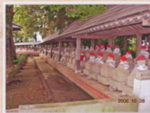
奉納されて祀られている百地藏