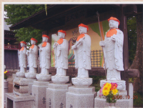
それぞれの姿で立つ六地藏