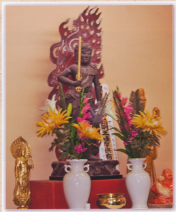
三十六ヶ寺のお不動様が集合した 会場祭壇に立つ不動明王像