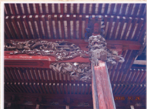
大本堂入り口上の唐獅子