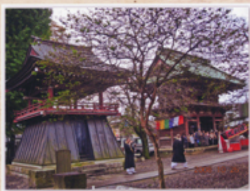
境内から見た鐘楼と楼門