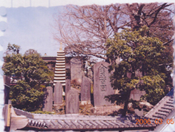
2006/03/05 午前11:35:05 総門近くに建立されている 歴史を物語る寄進碑