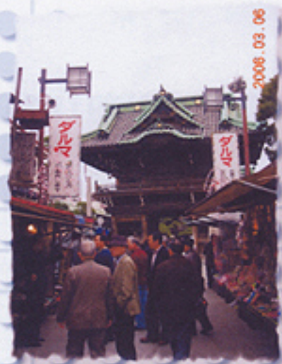
2006/03/06 午後02:15:46 柴又帝釈天の参道を歩く