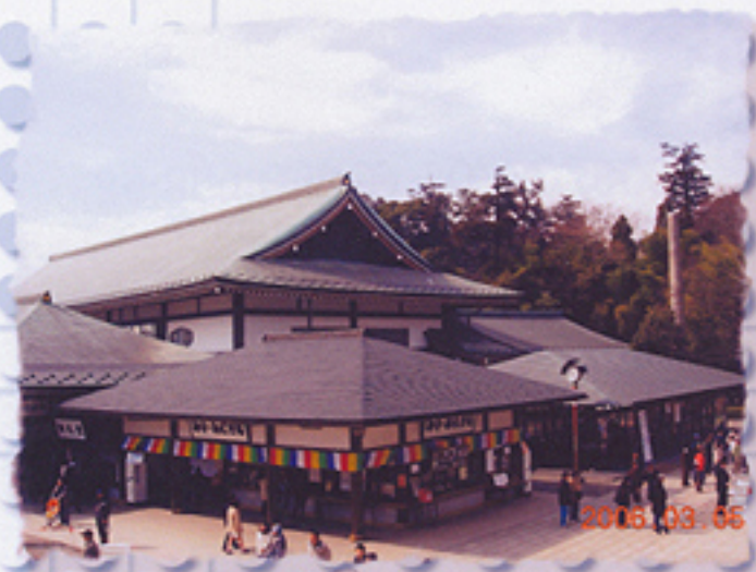
2006/03/05 午前10:26:01 大本殿境内の御護摩受付 所全景