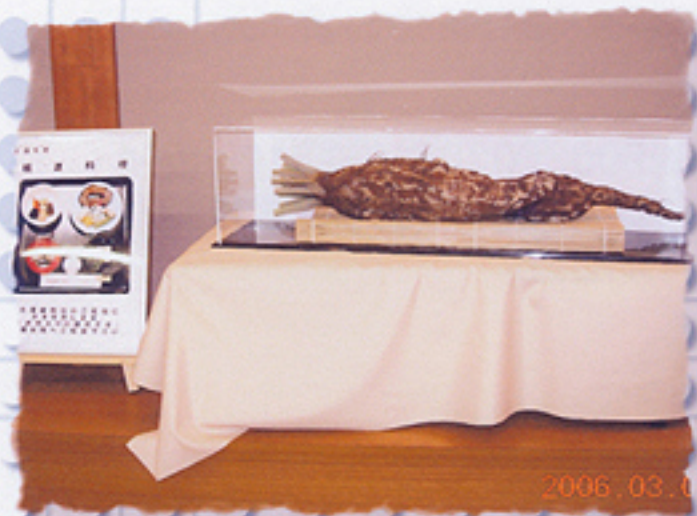
2006/03/05 午前09:58:52 大浦牛蒡と精進料理