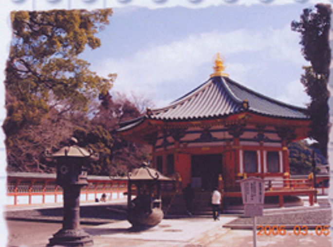
2006/03/05 午前10:28:14 八角形の聖徳太子堂