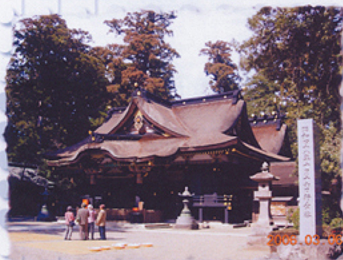
2006/03/06 午前11:35:32 香取神宮本殿