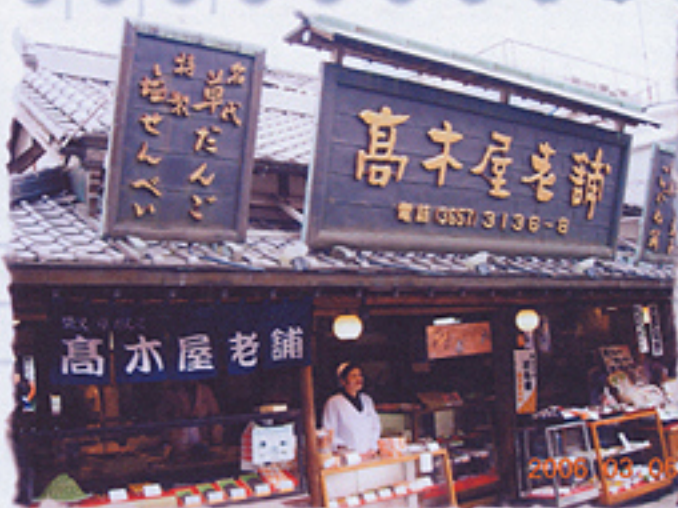
2006/03/06 午後02:41:46 映画寅さんのモデルとなつた高木屋だんご店