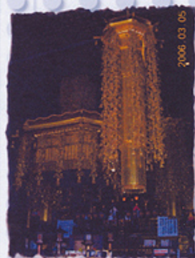
2006/03/05 午前10:47:47 大本堂大伽藍