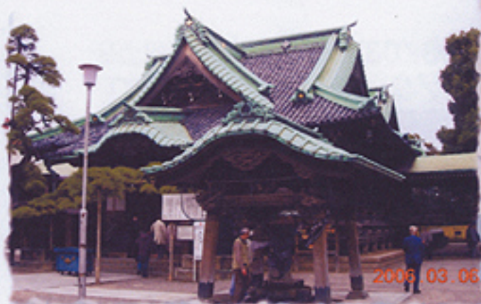
2006/03/06 午後02:19:20 柴又帝釈天本堂全景