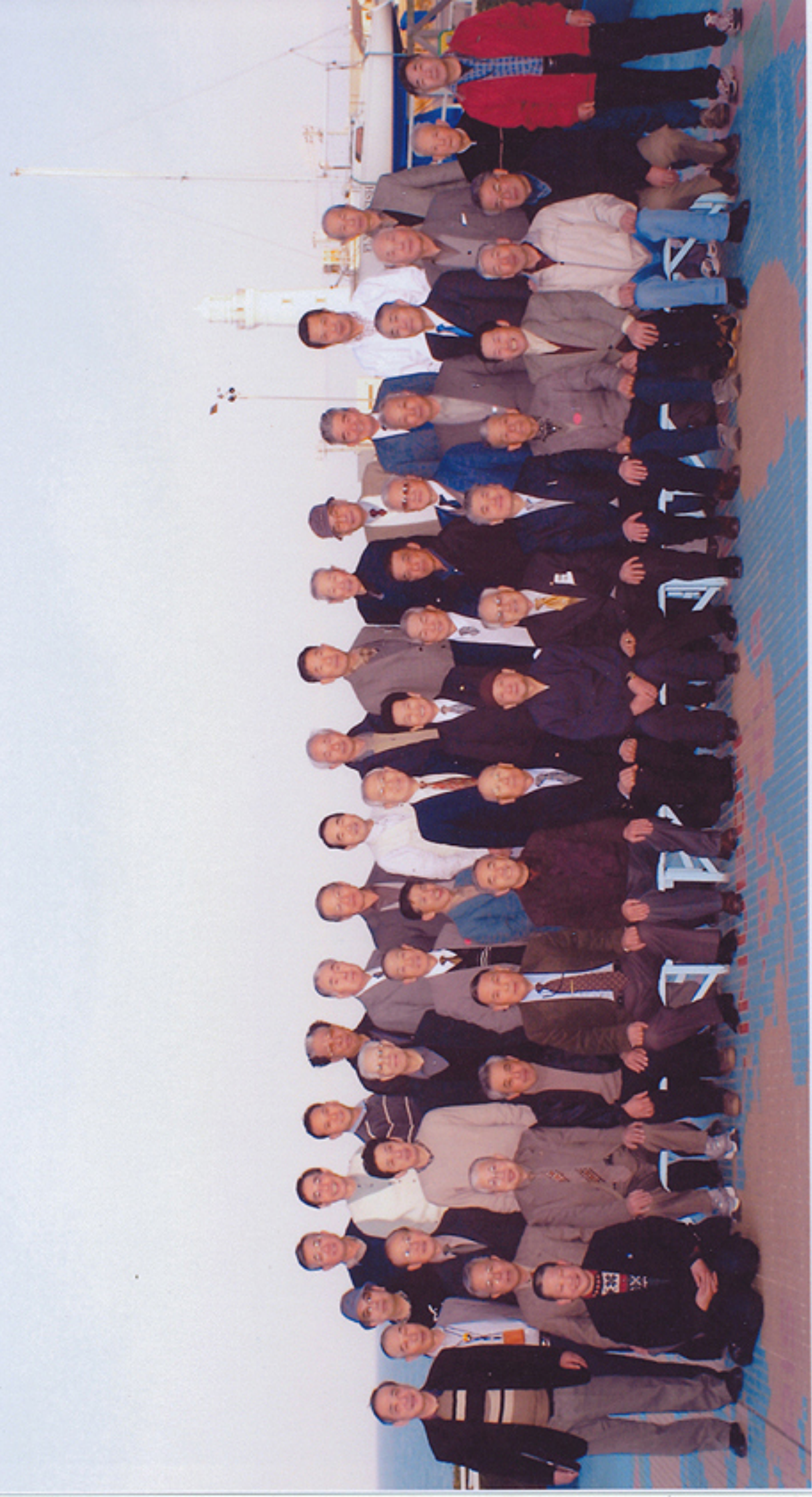
成田山金剛講御一行様 於 犬吠埼京成ホテル