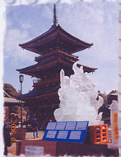
2006/03/05 午前10:09:00 三重塔と不動明王の氷彫 刻