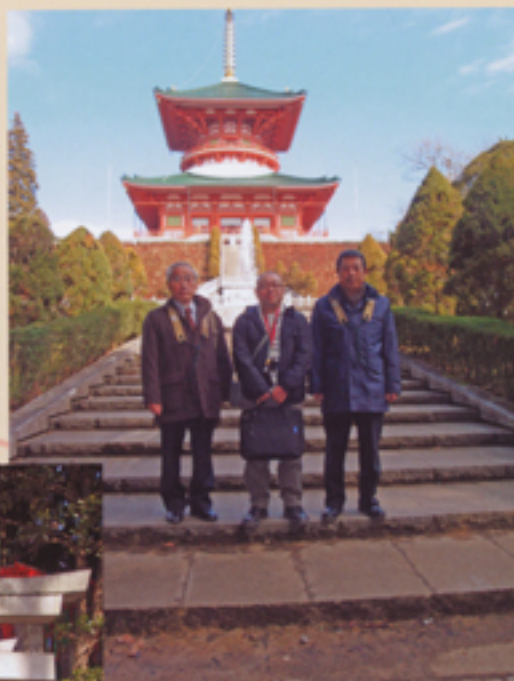
平和の大塔背景に