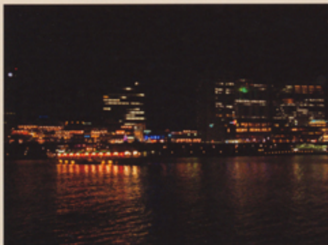
フジテレビ社屋を背に 隅田川を流す屋形船