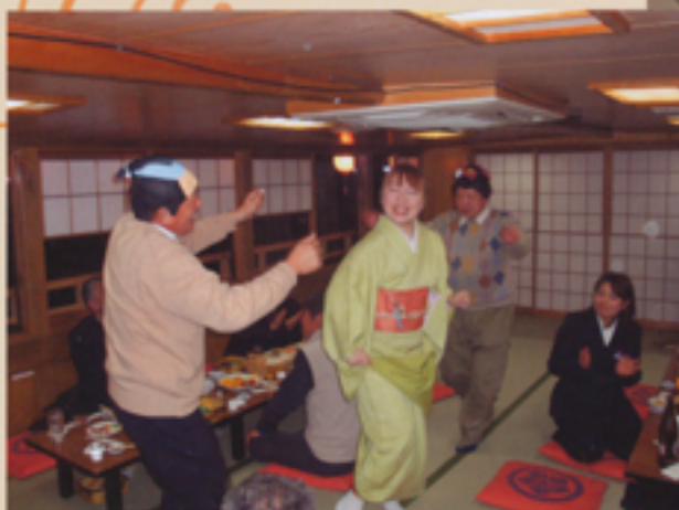
あーりやさッ こーりやさッ