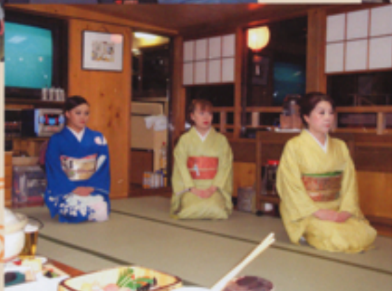
きれいどころが待ってます