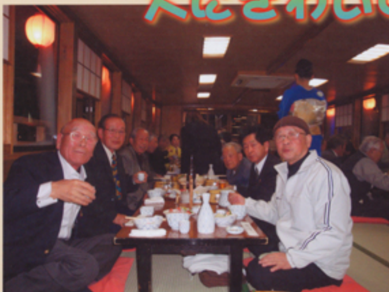
住職、講元などの皆さん