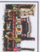
浅草演芸ホール 毎月落語協会と落語芸術協会が10日替わりで交互に公演を行っている。公演内容は、落語・漫才・漫談・ワザ・曲芸・紙切りなど