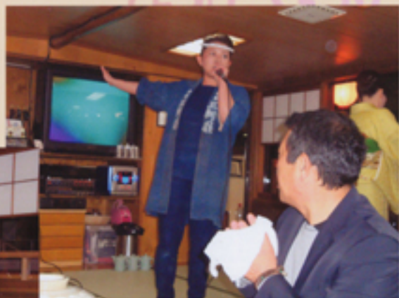
江戸っ子あんな船頭さん