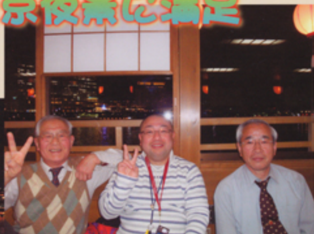
副住職と はいピース