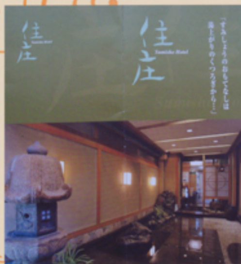
民宿並みの住庄ホテル