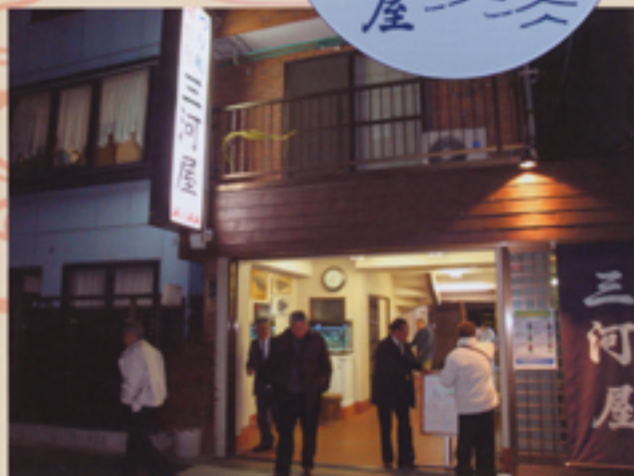
三河屋の屋形船を降りて