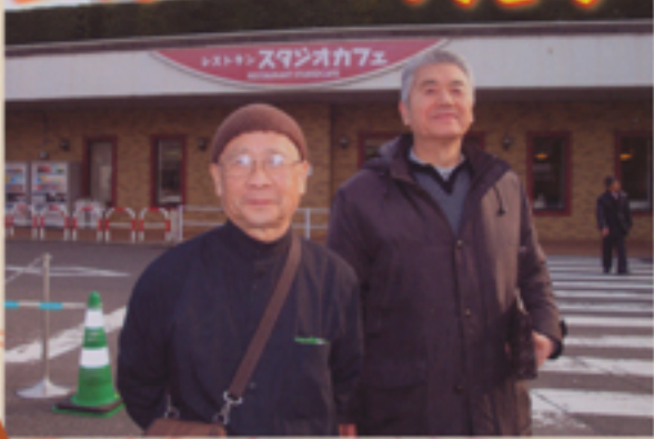
見学終えた住職と副講元