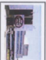
NHKスタジオパーク アナウンサー体験のできるスタジオQ、収録中のスタジオを要請しに来れる。