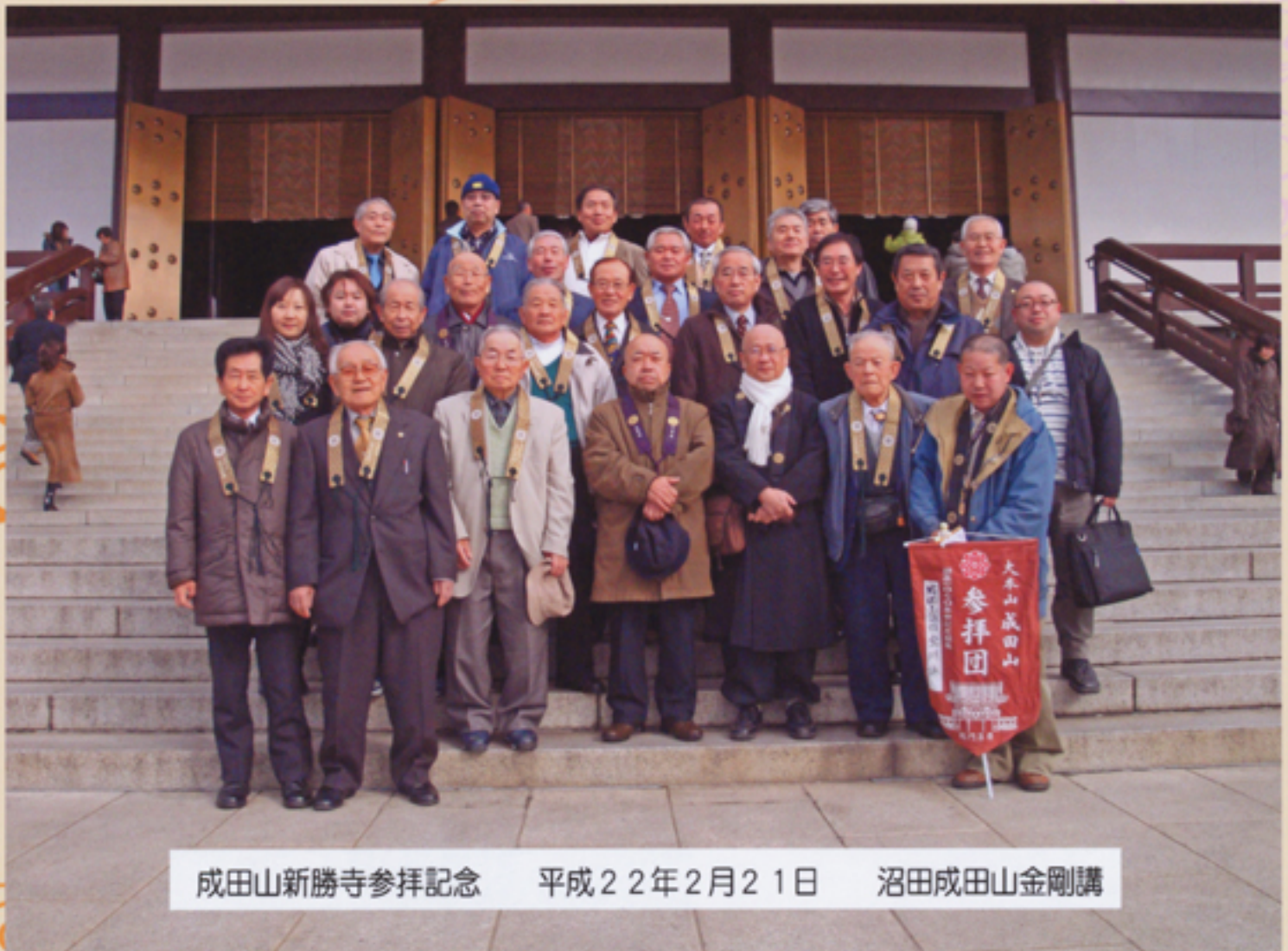
成田山新勝寺参拝記念 平成22年2月21日 沼田成田山金剛講