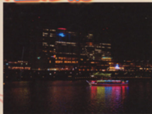
フジテレビ社屋と屋形船