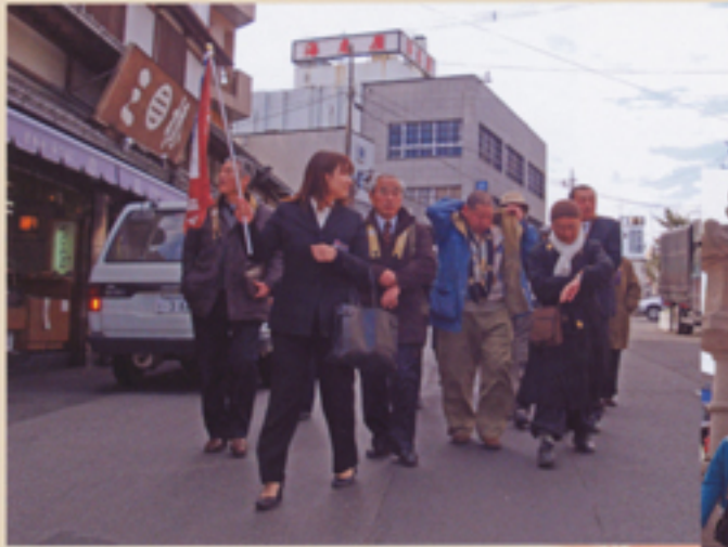
海老屋から新勝寺へ向かう