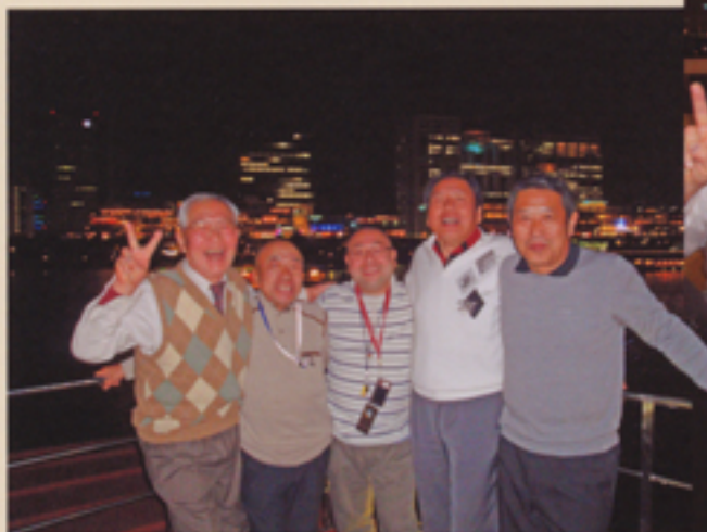
川面の風も気持ちよい 屋形船のデッキ