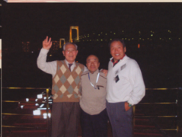
レインボーブリッジの下を抜ける