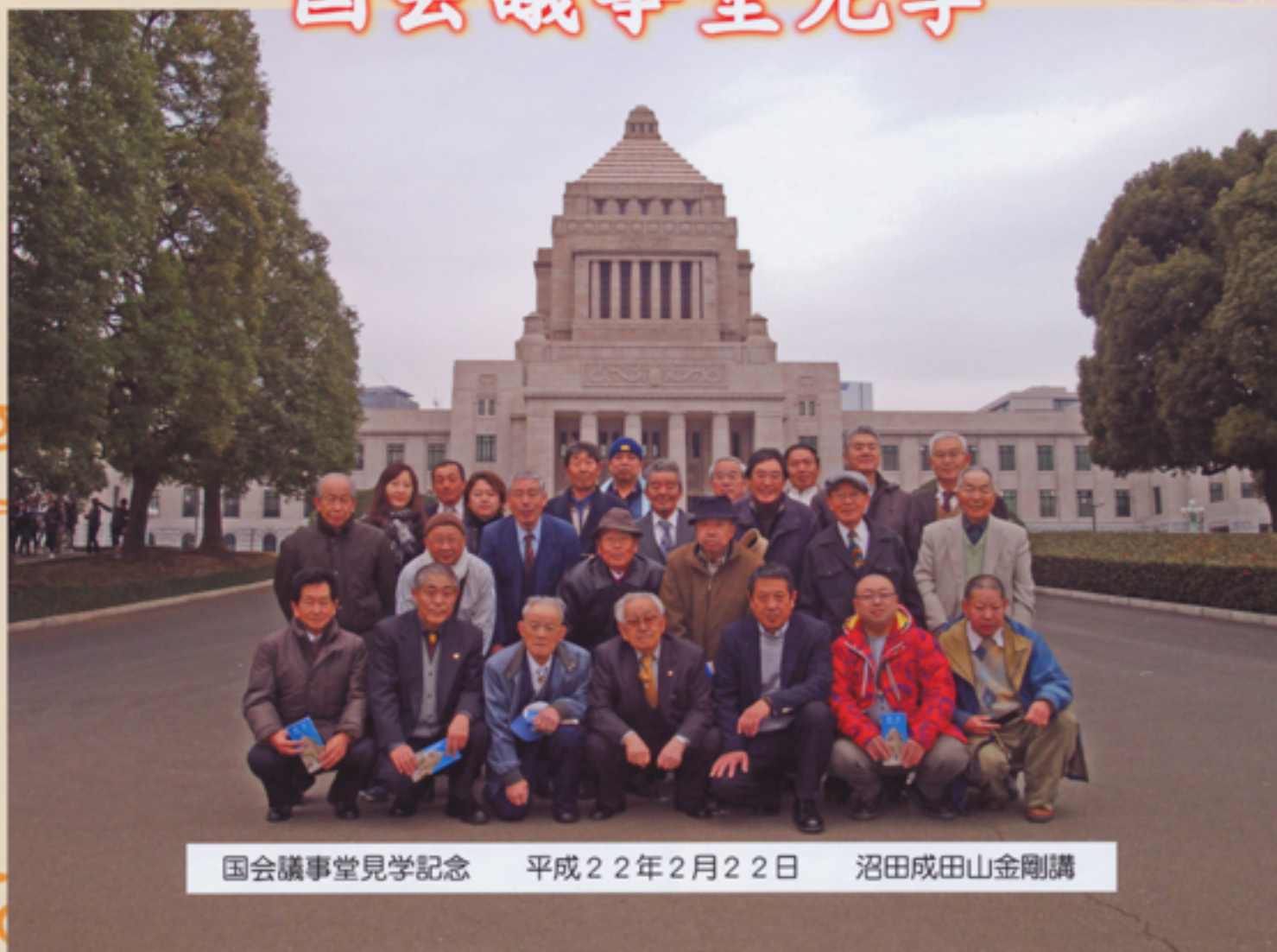
国会議事堂見学記念 平成22年2月22日 沼田成田山金剛講