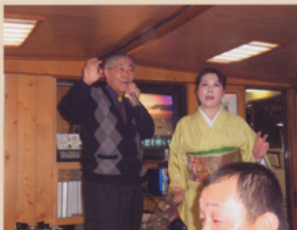
歌と踊りの大饗宴