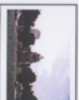
国会議事堂 大正9年から17年の歳月をかけて昭和11年に完成。中央部に高さ65.5mの塔を持つ左右対称の重厚な建物。第70回開会から使用され