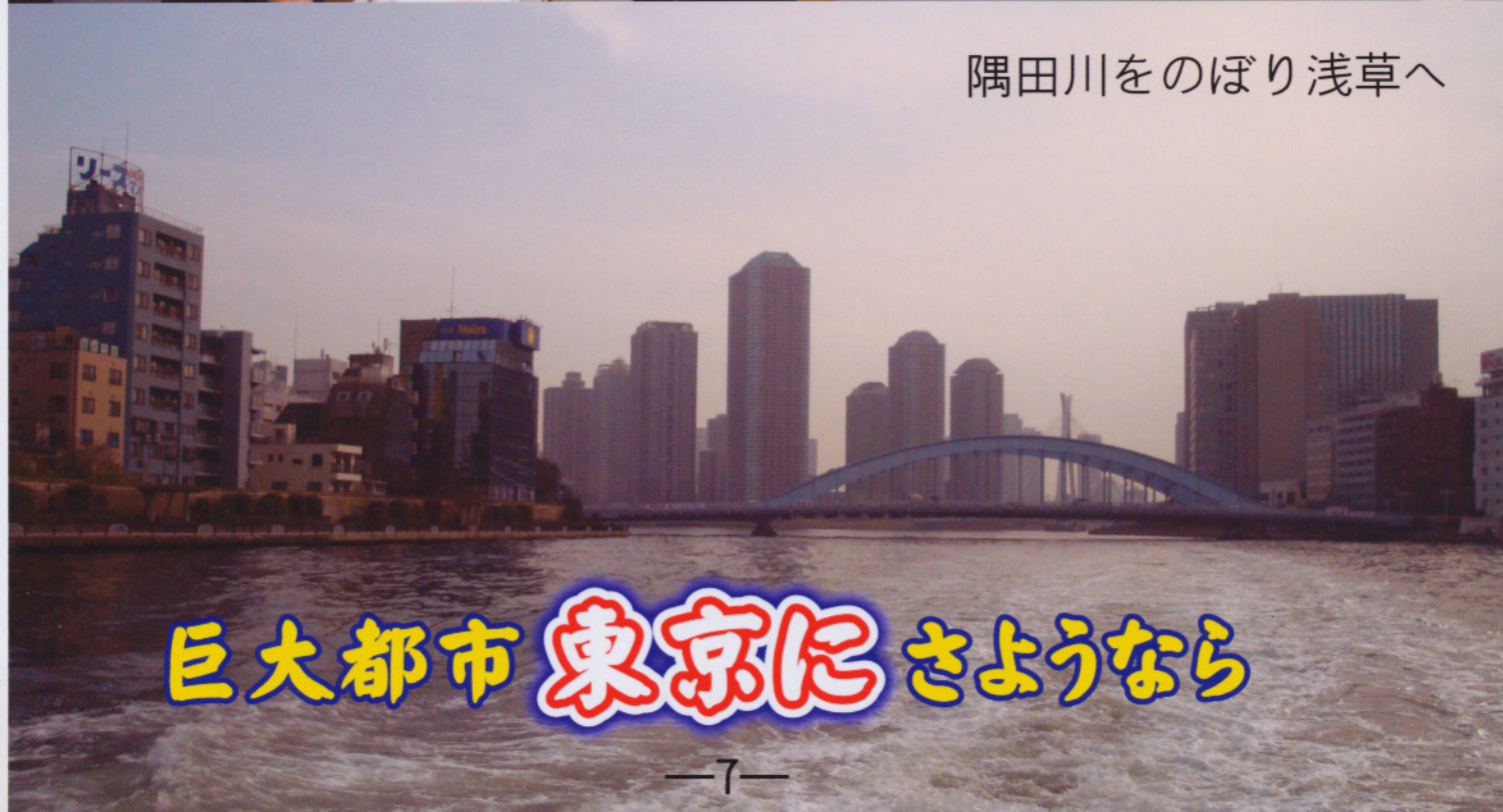
隅田川をのぼり浅草へ