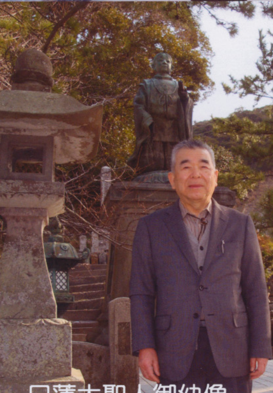
日蓮大聖人御幼像