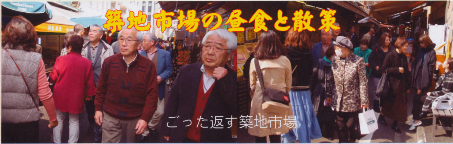
ごった返す築地市場